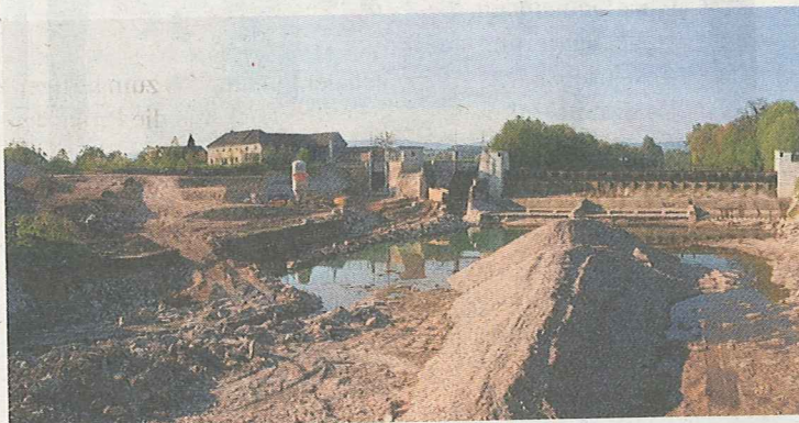
Die Baustelle beim Ybbs-Kraftwerk Allersdorf.

„Um die Fallhöhe von über acht Metern zu überwinden wird ein Fischaufstieg mit 56 Becken von jeweils zwei mal drei Metern errichtet, der es sogar größeren Fi-